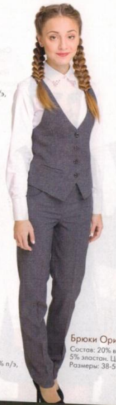
Брюки Ориана Состав: 20% вискоза, 75% п/э, 5% эластан. Цвет: Серый Размеры: 38-50