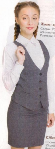
Жилет д/д Ориана Состав: 20% вискоза, 75% п/э, 6% эластан. Цвет: Серый Размеры: 38-52