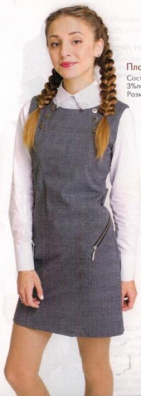
Платье Оксфорд Состав: 34% вискоза, 63% п/з, 3%лайкра. Цвет: Серая клетка Размеры: 36-46