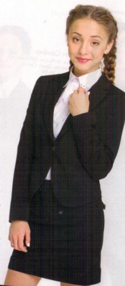
Юбка Агат Состав: 61% п/з, 35% вискоза, 4%эластан. Цвет: Серый Размеры: 36-48