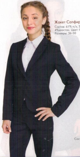
Жакет Сапфир Состав: 61% п/э, 35% вискоза, 4% эластан. Цвет: Синий Размеры: 36-50