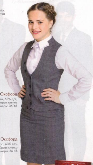
Юбка Оксфорд Состав: 34% вискоза, 63% п/з, 3%лайкра. Цвет: Серая клетка Размеры: 36-48