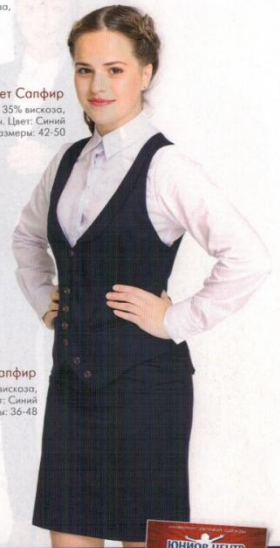
Юбка Сапфир Состав: 61% п/э, 35% вискоза, 4% эластан. Цвет: Синий Размеры: 36-48