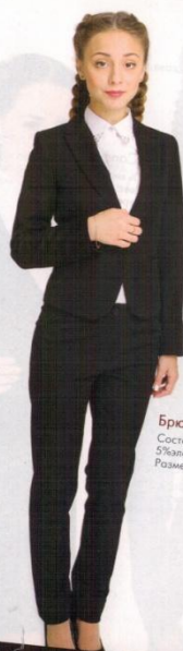
Жакет Агат Состав: 60% п/з, 35% вискоза, 5%эластан. Цвет: Серый Размеры: 36-50