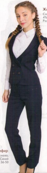
Жакет Сапфир Состав: 61% п/э, 35% вискоза, 4% эластан. Цвет: Синий Размеры: 36-50